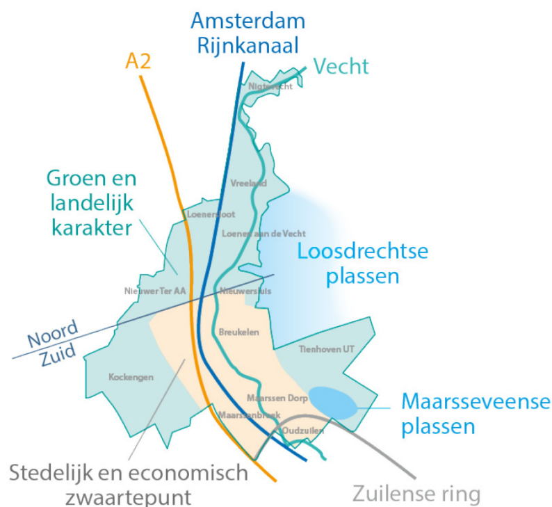
Figuur 2.2 De economische geografie van Stichtse Vecht