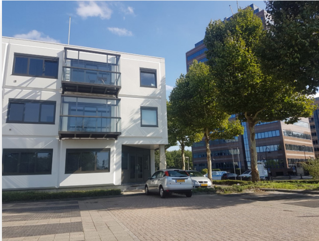
Figuur 5.1 Getransformeerde panden aan de Planetenbaan