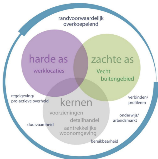
Figuur 4.1 Schematische weergave economisch profiel gemeente Stichtse Vecht