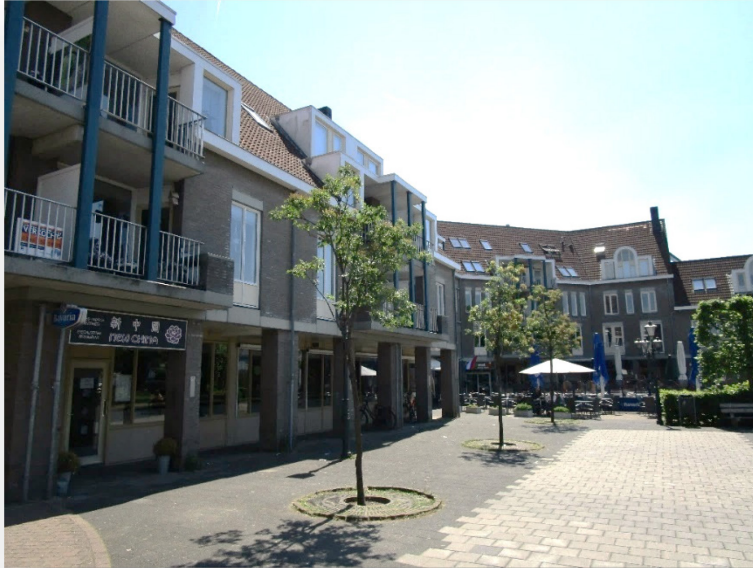
Figuur 5.4 Maarssen-Dorp