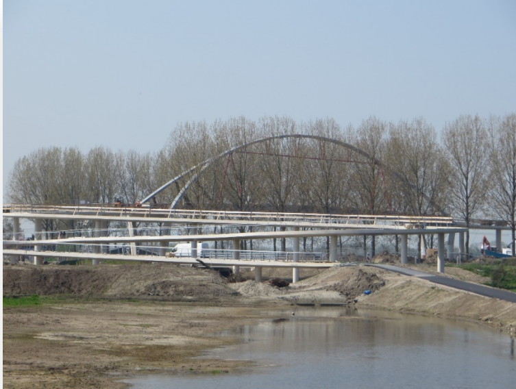
Afbeelding 5.6 Fietsbrug Nigtevecht