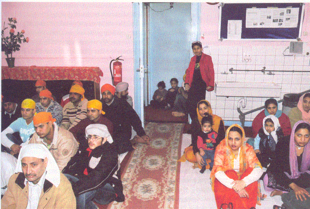
Sikttempel van de Vereniging Gurdwara Sri Guru in Den Haag.

De huisvestingsproblemen die door Haagse religieuze organisaties worden gevoeld zijn terug te voeren tot een aantal